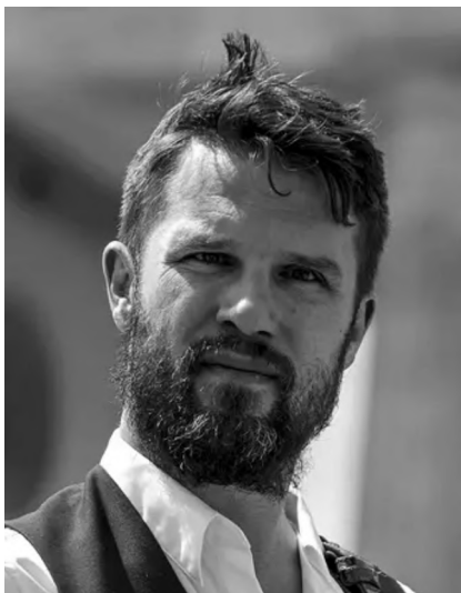
Tomas Mazetti